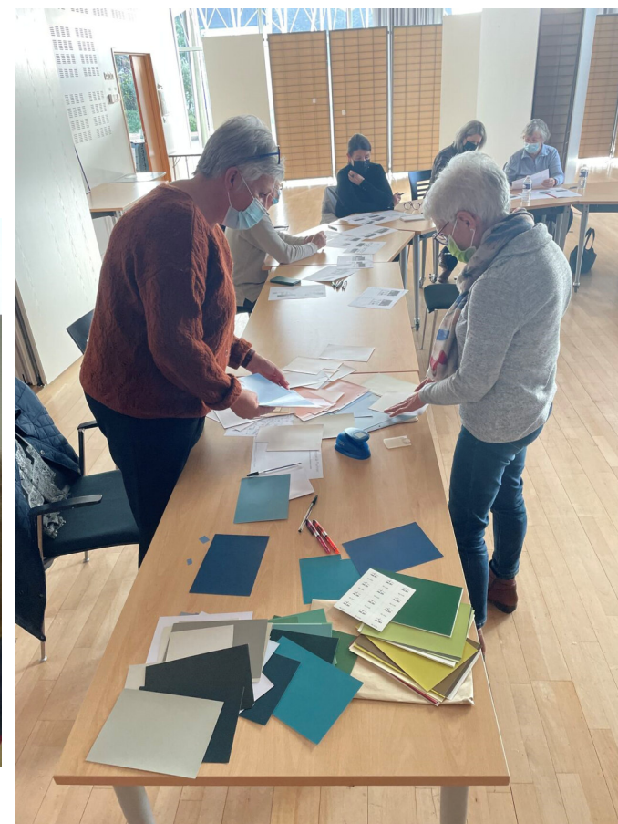
Atelier couleurs 19 novembre 2021