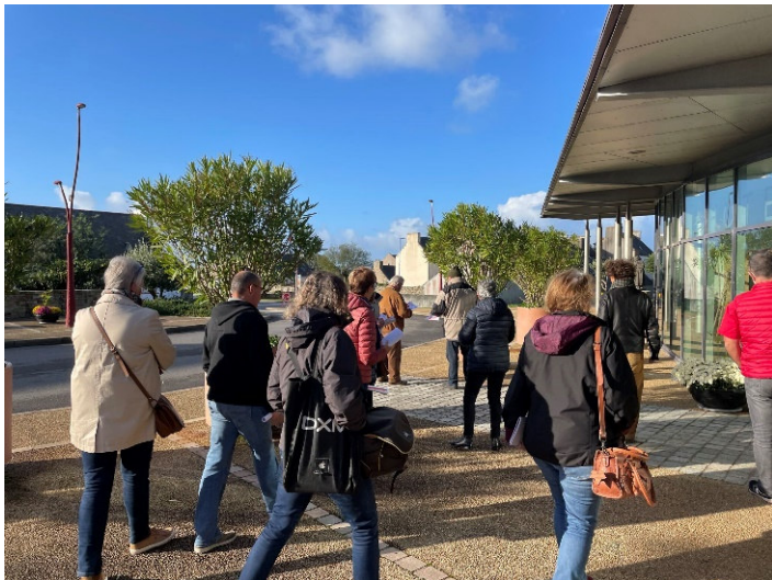
Balade habitants 29 octobre 2021