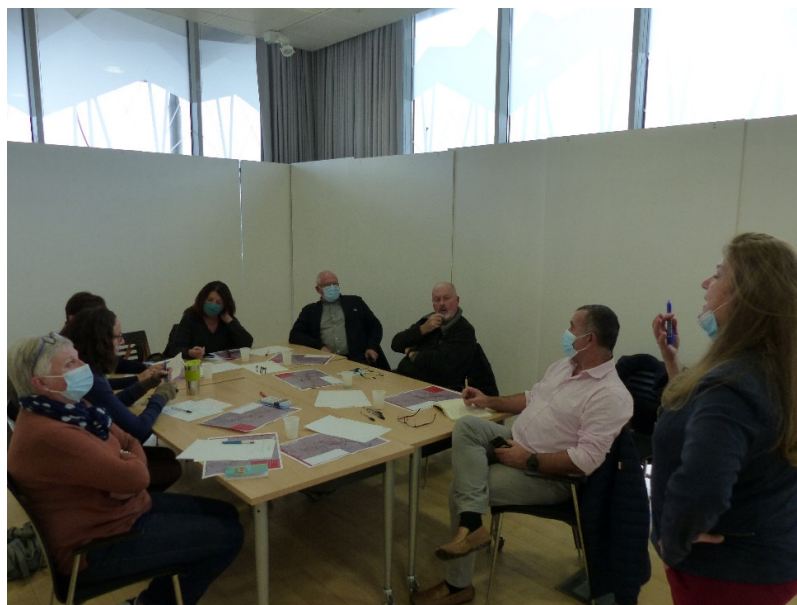
Atelier attractivité 8 novembre 2021