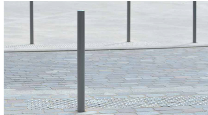
Potelet acier amovible