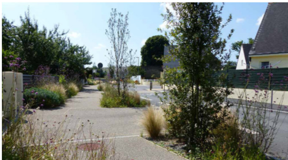
Arbres au port fastigié en bord de route