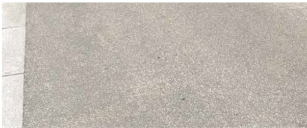
Enrobé grenailé (sur la chaussée dans le centre-bourg)