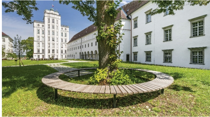
Banc circulaire en pied d'arbre