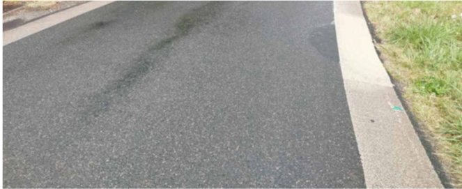
Enrobé noir et bande de résine en rives (en dehors du centre-bourg)