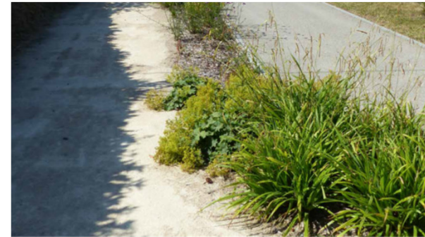
Platebande en rive de chaussée