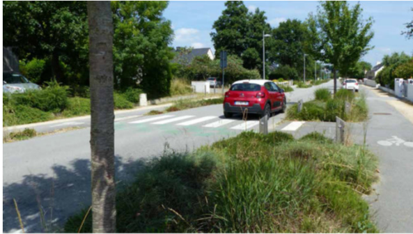
Noüe plantée en bord de route