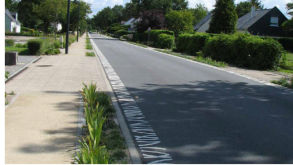
Marquage au sol en rive de chaussée et platebande plantée