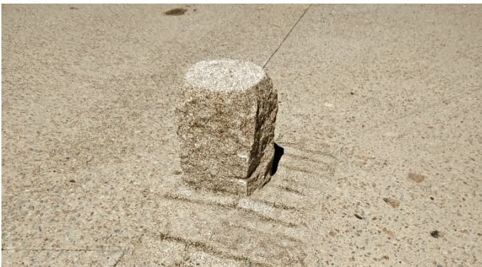
Borne en granit