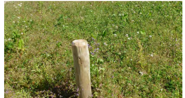
Potelet en châtaignier écorcé