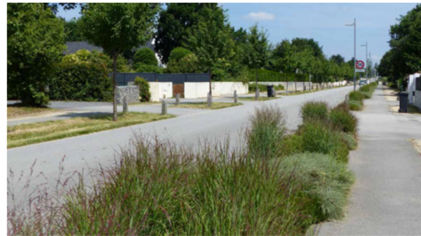
Platebande en rive de chaussée