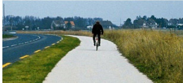
Enrobé coloré (sur la voie verte et les trottoirs hors centre-bourg)