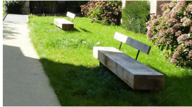
Banc bois et acier