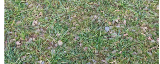
Mélange terre-pierre (pour les stationnement hors centre-bourg)